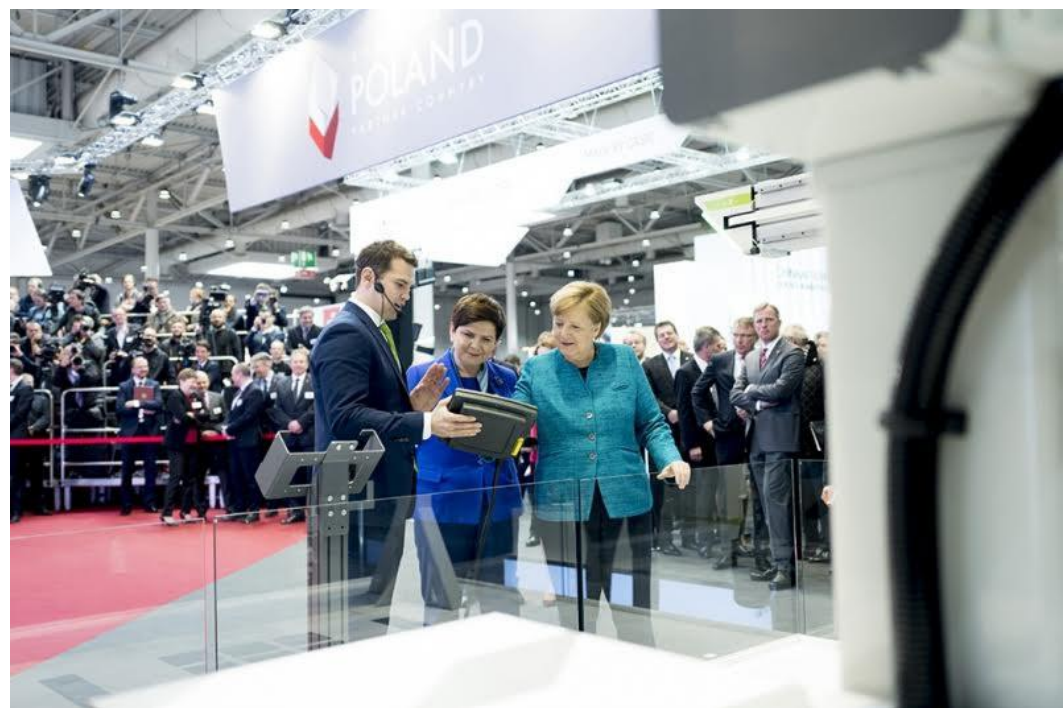
Hannover Messe. 25.04.2017.