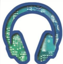
Electronics (Autumn) electronicAsia