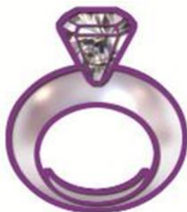
Jewellery Diamond, Gem & Pearl