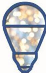
Lighting (Autumn) Outdoor Lighting