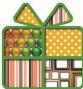
Gifts & Premium