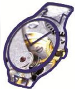
Watch & Clock