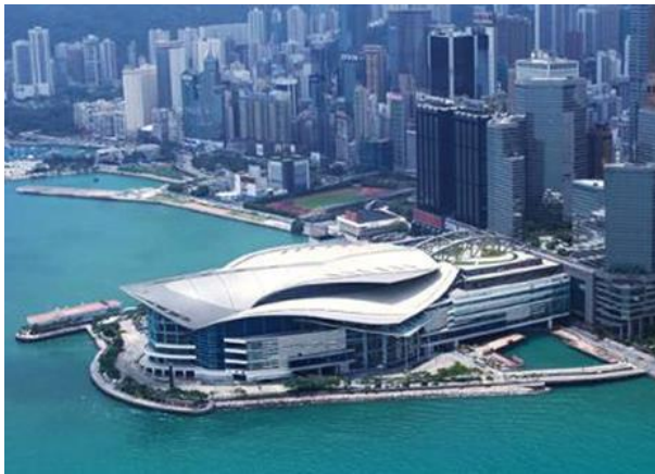
Hong Kong Convention & Exhibition Centre (HKCEC)