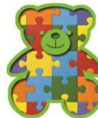
Toys & Games