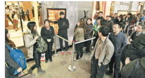
Kolejki pod sklepami luksusowych marek w Hongkongu